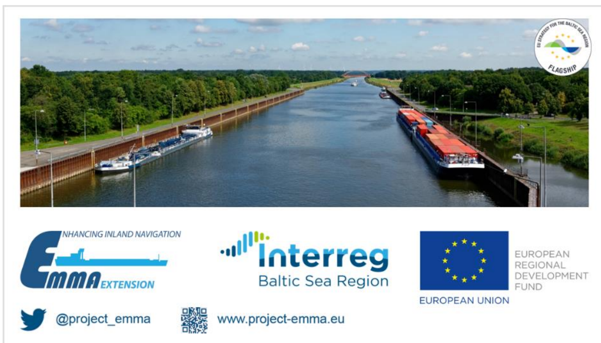
Rysunek 3 – Napisy końcowe, sekwencja 3/3