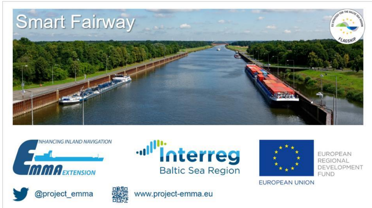
Rysunek 1 -Rzut Intro (Przykład dla Smart Fairway Pilot)